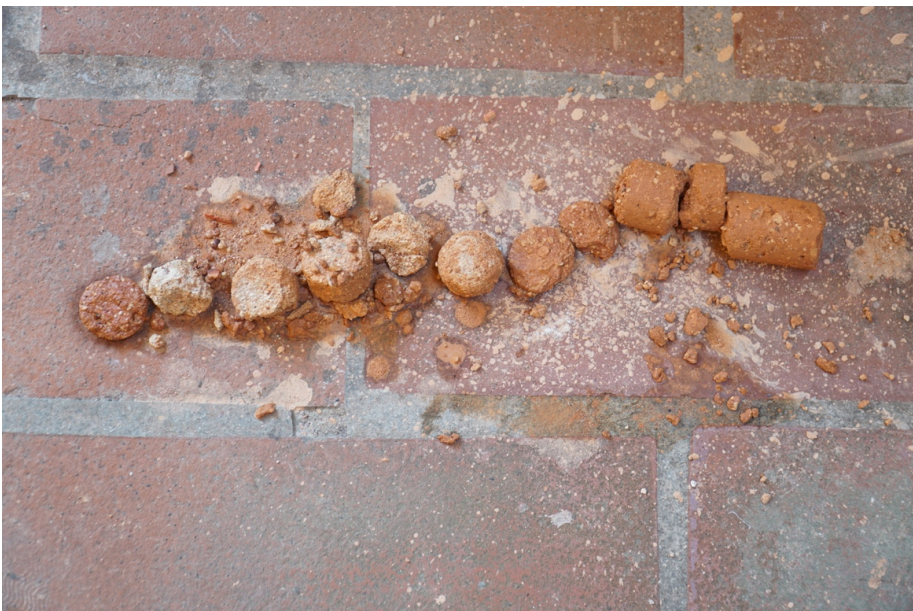
Testimone n.1 del carotaggio del blocco 10.