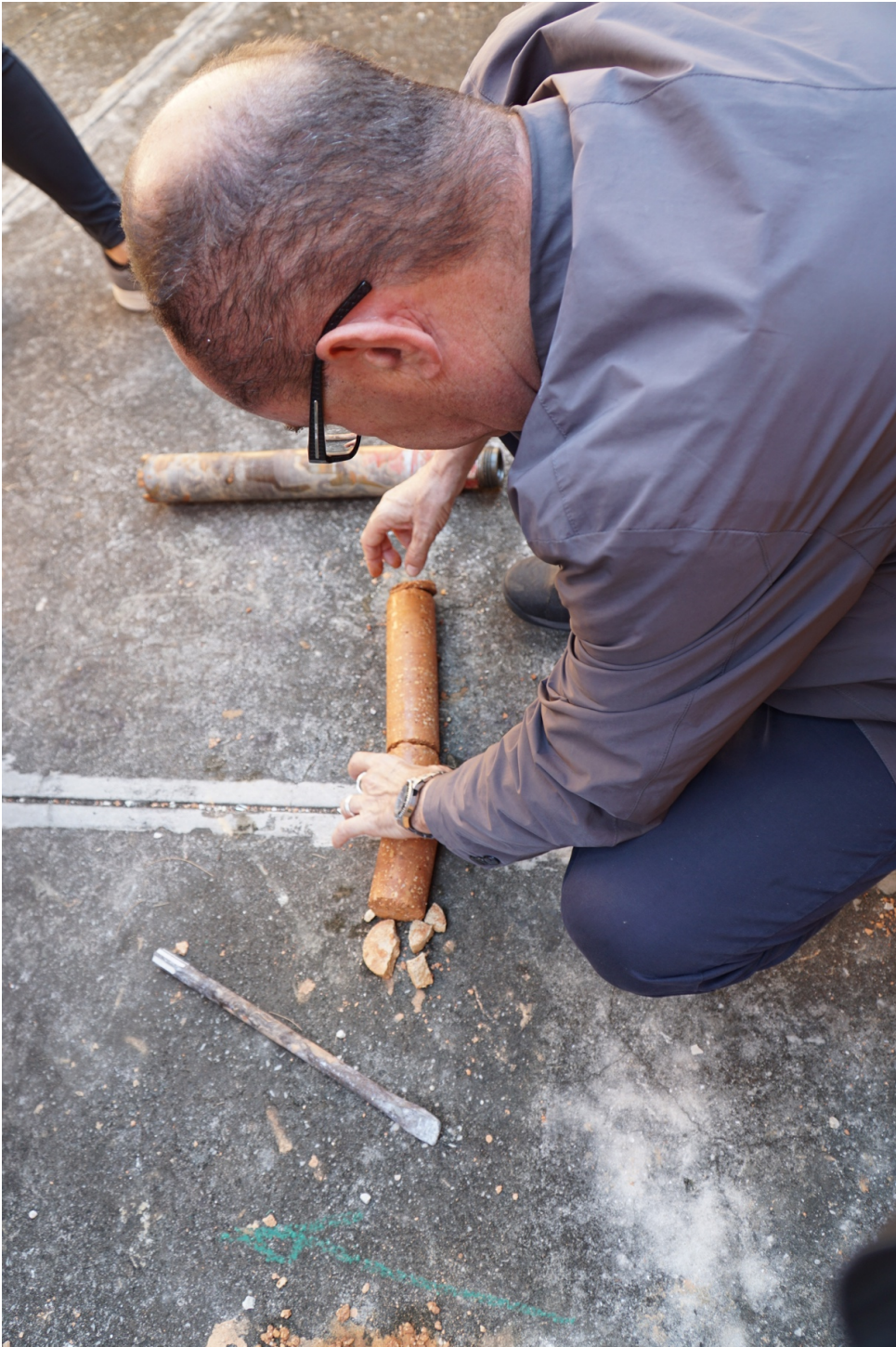
Testimone n.3 del carotaggio passante del blocco 11