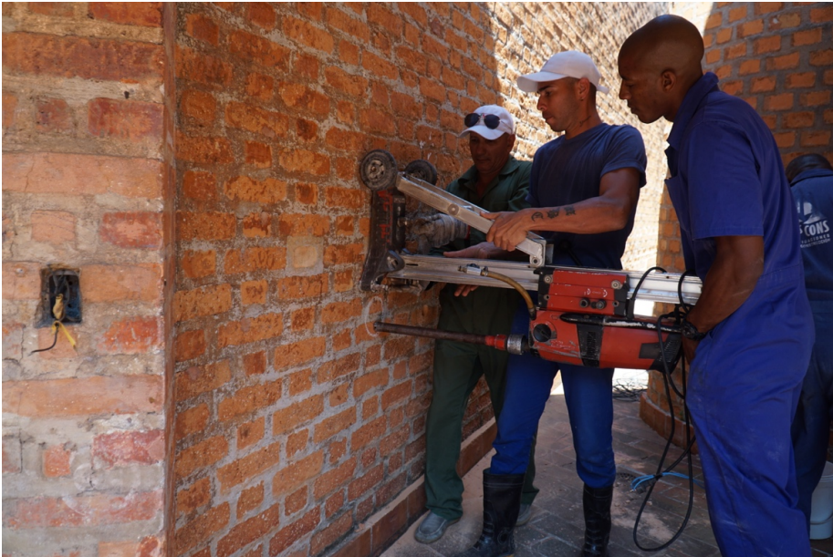
Carotaggio blocco 10, con tazza da 37 mm.

archivio. Merlo e Mecca gli propongono di pubblicare con il DIDA tale materiale, documentando così gli interventi realizzati dal 2000 al 2010 nelle Scuole d'Arte. Garcia Lorenzo accetta di buon grado.