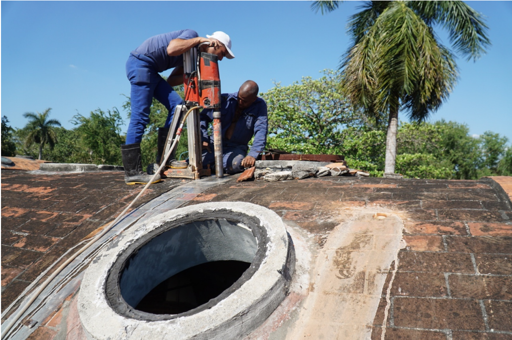
Carotaggio della volta del blocco 9 vicino al lucernario