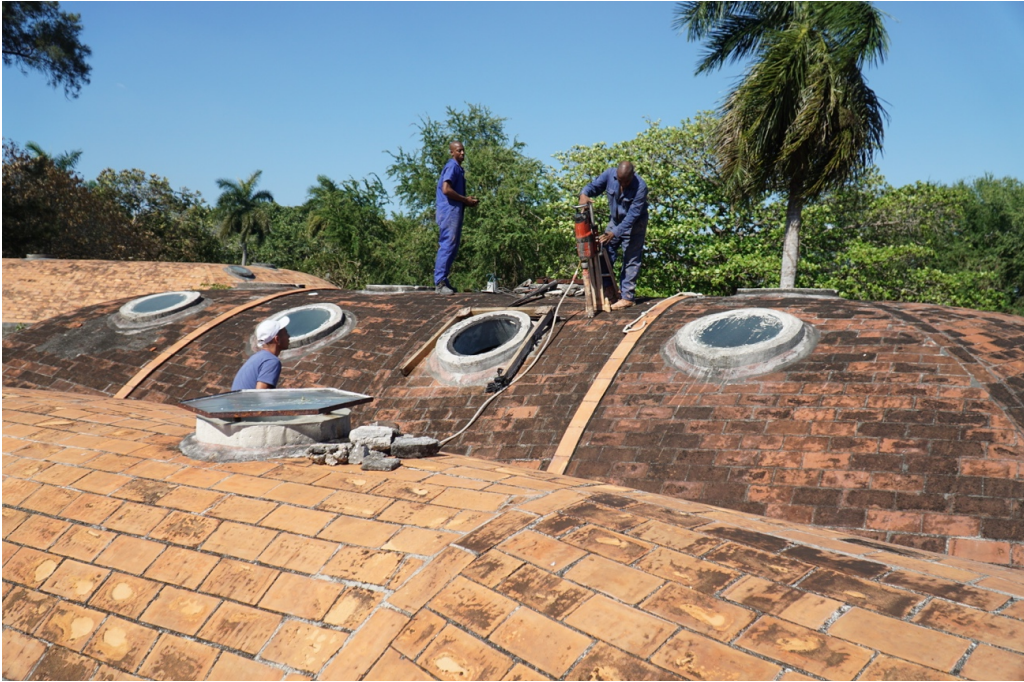
Carotaggio della volta del blocco 9