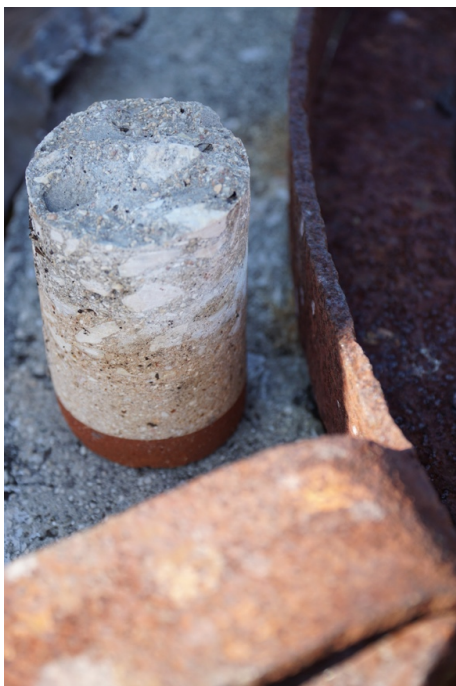
Testimone del carotaggio della volta del blocco 9, non passante, vicino al lucernario