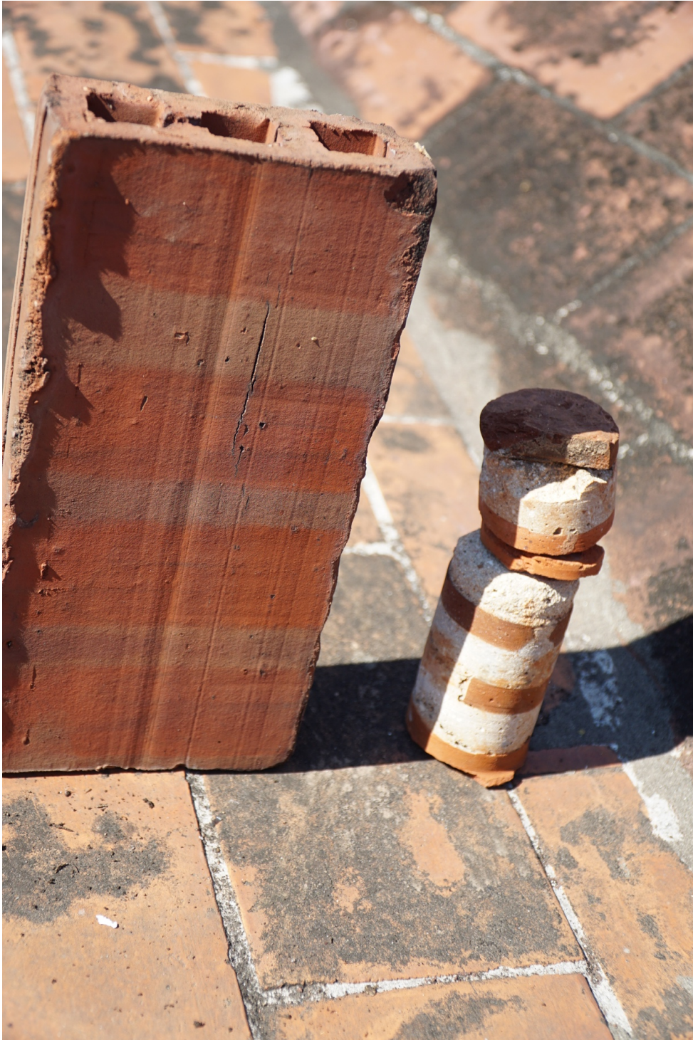
Testimone del carotaggio passante della volta del blocco 9