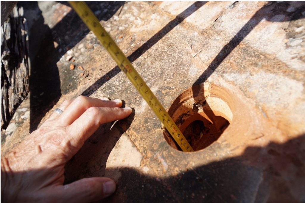
Testimone passante del carotaggio del blocco 9