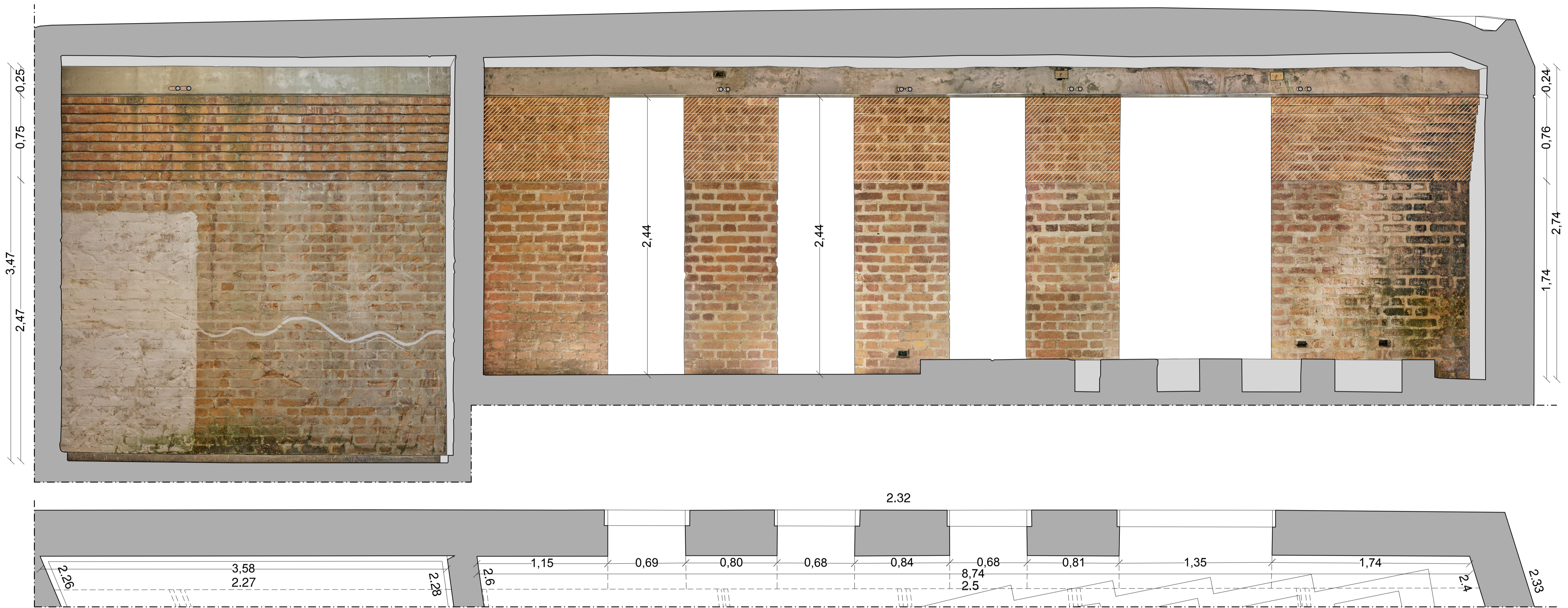
Paredes 5 y 27

Porción de fotoplano a sustituir Falta de datos