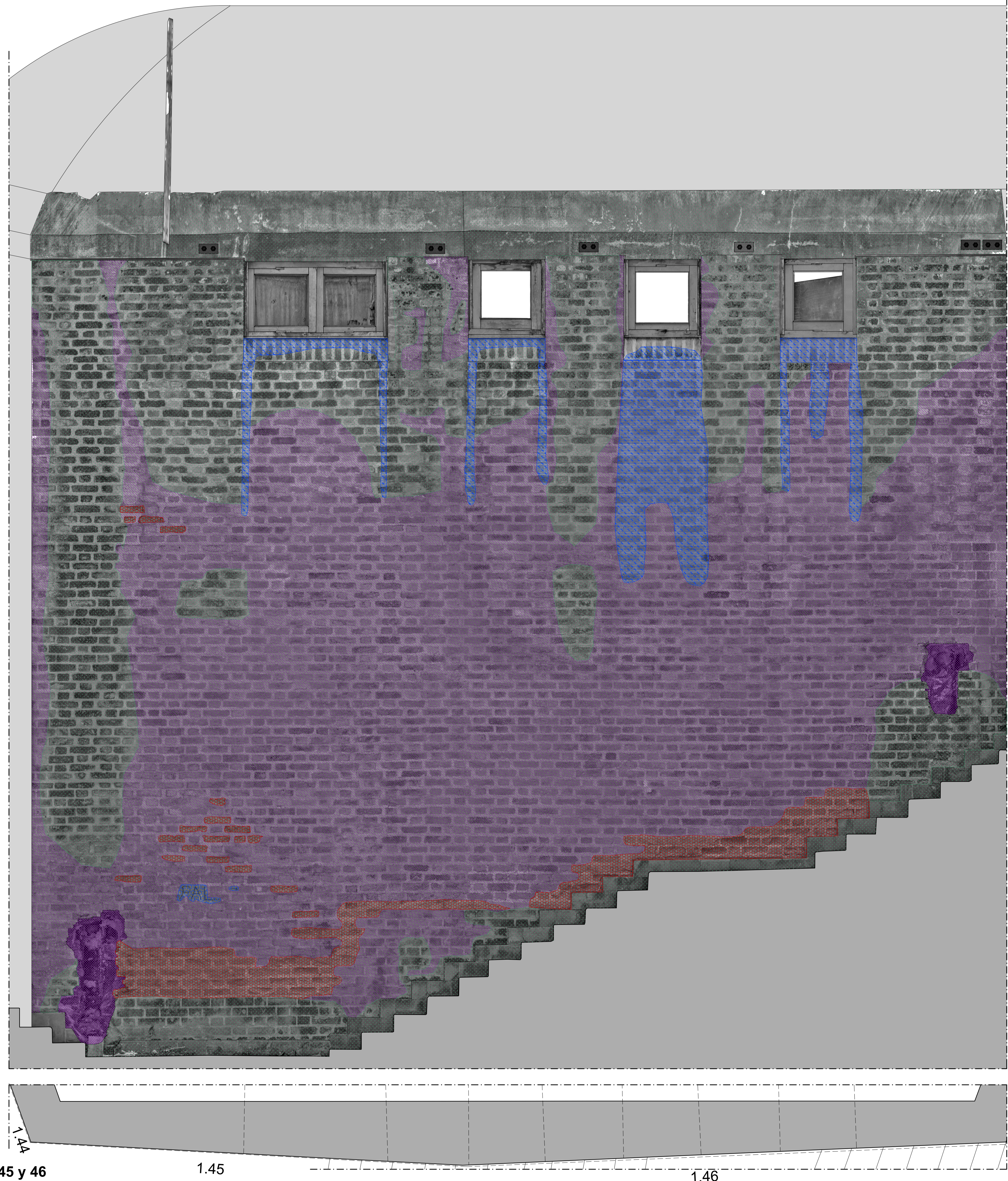
Paredes 45 y 46