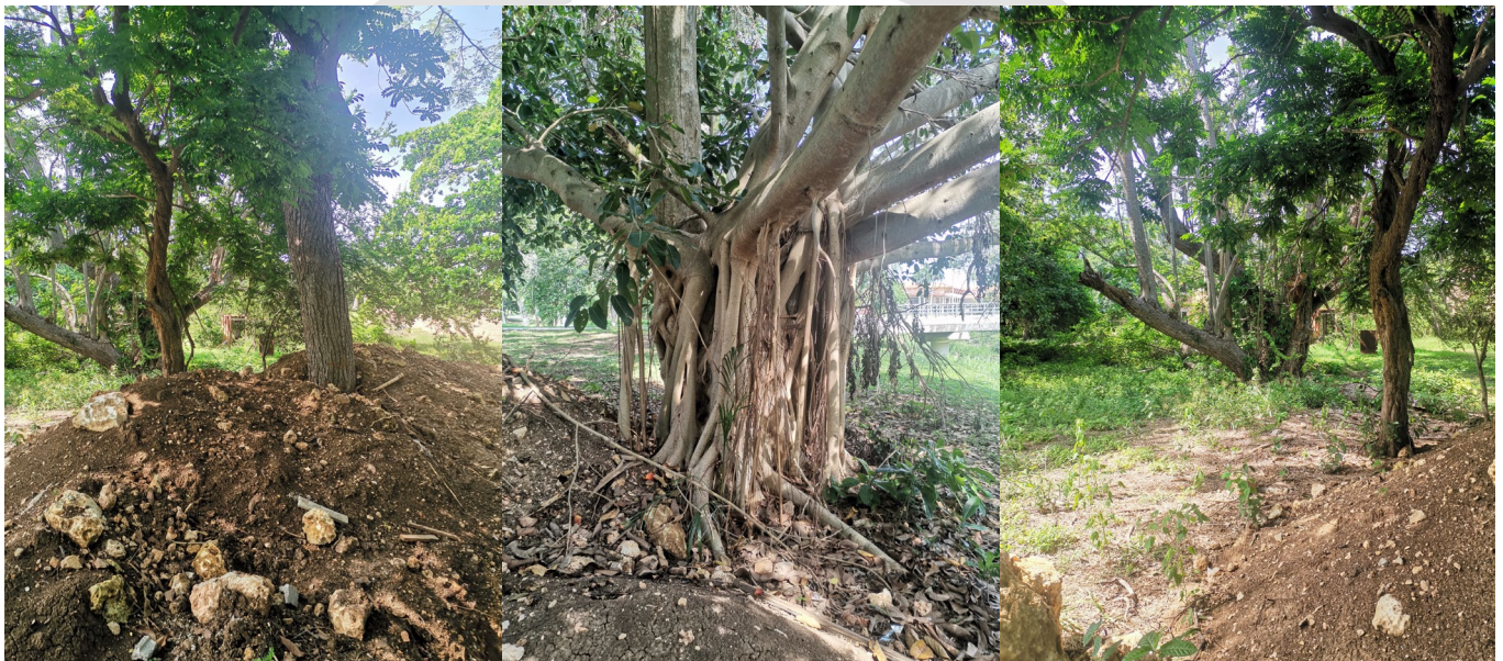
Img 2, 3, 4. Imágenes de la vegetación circundante al tanque séptico.