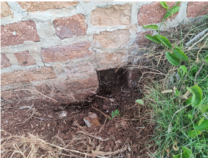
img 5. Salida de bajantes pluviales

En obra: vimos las salidas de los bajantes pluviales que con el estudio se pudieron descubrir porque en su mayoría todas las salidas habían quedado cubiertas por la vegetación y se constató que en su mayoría son por evacuación libre.