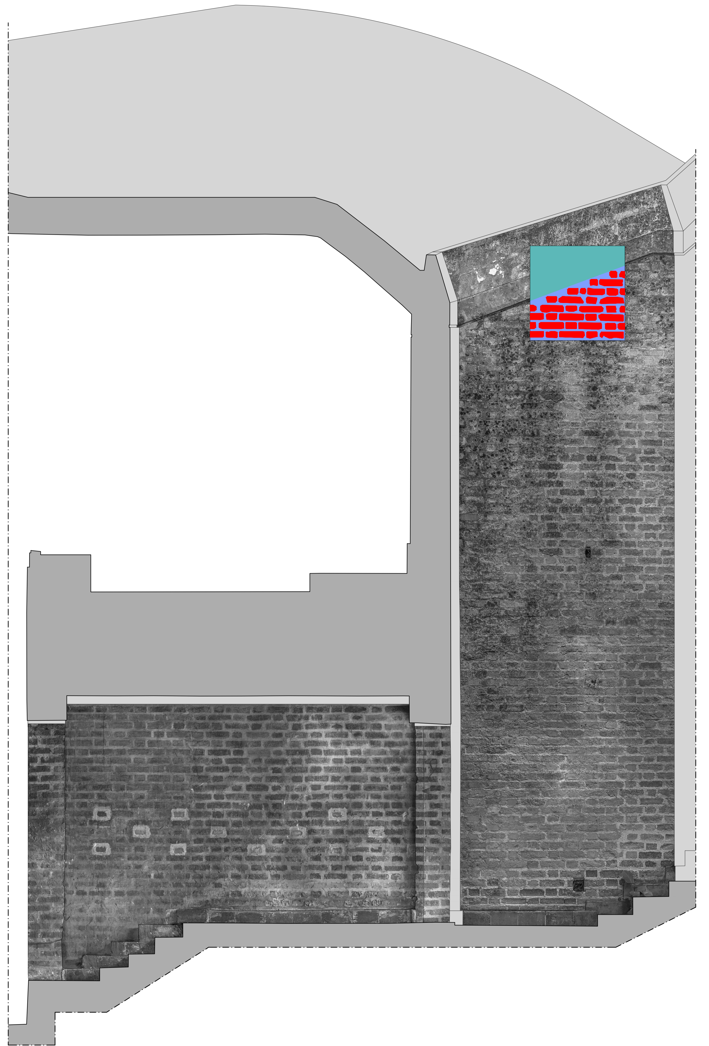
Paredes 23 y 27