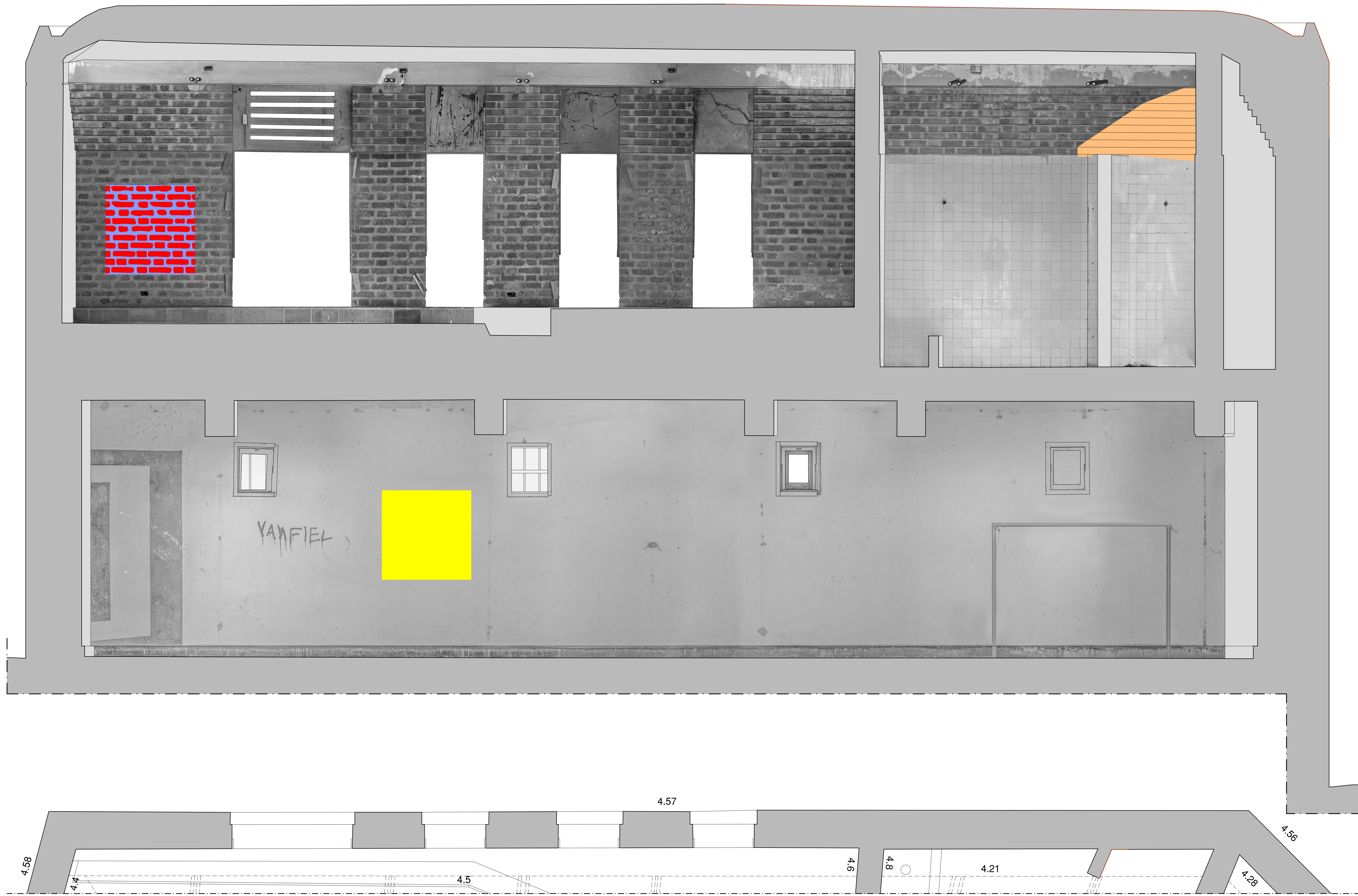
Paredes 5 y 21