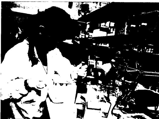
Una ricercatrice al Campus Biomedico di Roma, l'università legata all'Opus Dei

e accusato i vertici di associazione a delinquere finalizzata alla truffa. Per più di dieci anni la San Tommaso aveva aiutato aspiranti laureati, con supporto tecnico, legale e burocratico, a conseguire lauree o diplomi in università riconosciute. Ma non si era limitata a questo: core business dell'associazione era una collaborazione con le Università rumene Tito Miorescu e Vasile Goldis tramite le quali offriva corsi di Odontoiatria in Romania. Molti gli iscritti a corsi per un titolo che in Italia non ha alcun valore legale. Ma chi ci fa caso, appeso a un muro di un paesino della Bassa.