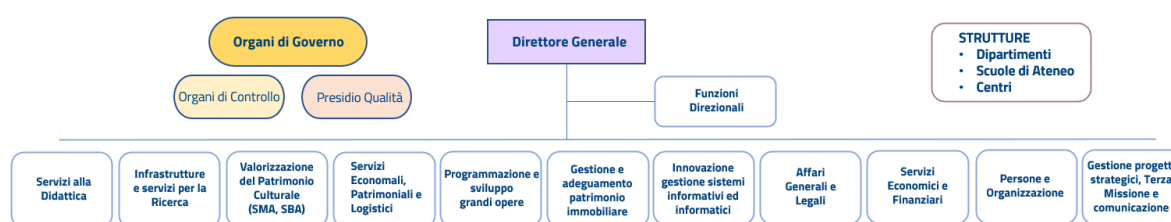
Fig. 3.2 – Aree Dirigenziali Unifi al 31/12/2024.

La gestione tecnica, amministrativa, finanziaria e patrimoniale dell'Ateneo è affidata alla Struttura Amministrativa che, sotto il coordinamento del Direttore Generale, garantisce funzionalità alle attività istituzionali e di servizio di tutte le strutture. L'attuale articolazione amministrativa comprende 11 Aree Dirigenziali (cfr. fig. 3.2), ciascuna caratterizzata da una propria organizzazione interna, in ragione dei processi gestiti. Le funzioni di supporto alle strutture didattiche e di ricerca sono presidiate dalla compagine tecnico-amministrativa afferente a Dipartimenti, Scuole e Centri.