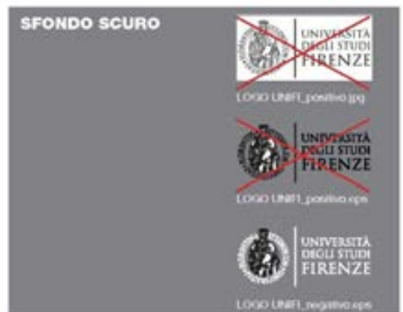
Uso corretto dei formati